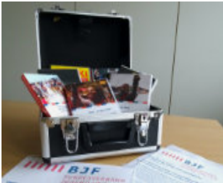
BJF Starterpaket: 10 DVDs inkl. Praxisleitfaden

Wer selbst mit eigenen Filmveranstaltungen loslegen will, kann die FilmPerlen als Starterpakete ausleihen.