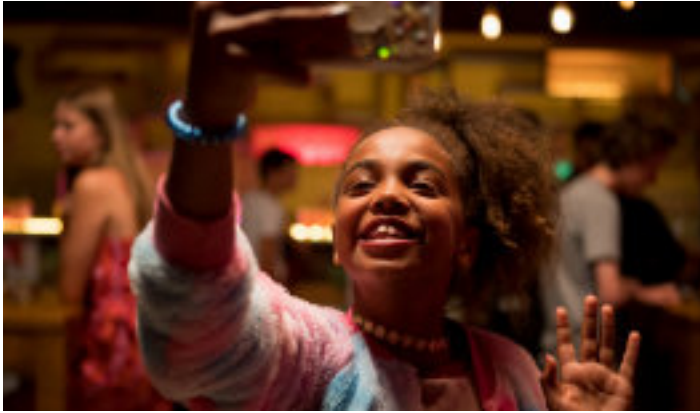
"Binti - Es gibt mich!", Spielfilm, Belgien 2019, Regie: Frederike Migom

Mit "Nacht & Nebel" (1996) und "Masel Tov Cocktail" (2021) stehen sich 2 kontrastreiche Filme zum Thema Antisemitismus gegenüber, um sowohl eine der ersten filmischen Auseinandersetzungen mit dem Holocaust aufzugreifen, als auch um mit Teilnehmenden ins Gespräch über gegenwärtiges jüdisches Leben in Deutschland zu kommen.