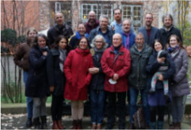
Arbeitstreffen der BJF-Landesverbände während der Nordischen Filmtage in Lübeck 2021