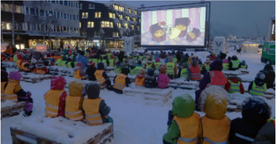
Morgendliches Freiluft-Kino am Hafen für Kinder im Rahmen des Festivals

Hinzuweisen ist noch auf den von gleich zwei weiteren Jurys ausgezeichneten Film "Medusa" der jungen brasilianischen Filmemacherin Anita Rocha da Silveira, der aus feministischer Perspektive ein sehr aktuelles Themen aufgreift und zeigt, wie sich christlicher Fundamentalismus, gepaart mit ganz auf äußerliche Schönheit fixierten Rollenbildern mit ultrarechten Kräften verbinden, um die demokratische Gesellschaft aus den Angeln zu heben. Ein Film, der auch für die kommende Jahrestagung des BfJ von Interesse sein könnte.