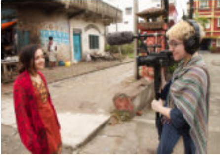
"Youth Unstoppable", Kanada 2019