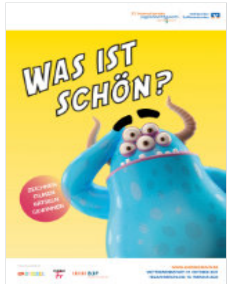
Wettbewerbsmotive - 52. Internationaler Jugendwettbewerb

Obwohl Heranwachsende in ihrem Alltag häufig mit stereotypen Schönheitsidealen konfrontiert sind, fühlt sich der Umfrage zufolge fast die Hälfte der jungen Bundesbürger*innen (48 Prozent) vom Schönheitskult in sozialen Netzwerken wenig bis gar nicht beeinflusst. 21 Prozent der Befragten (weiblich 12 Prozent, männlich 30 Prozent) lassen die in den sozialen Medien inszenierten Schönheitsideale völlig kalt. 38 Prozent der befragten Mädchen und jungen Frauen geben an, sich beeinflussen zu lassen – bei den Jungen und jungen Männern sind es 17 Prozent.