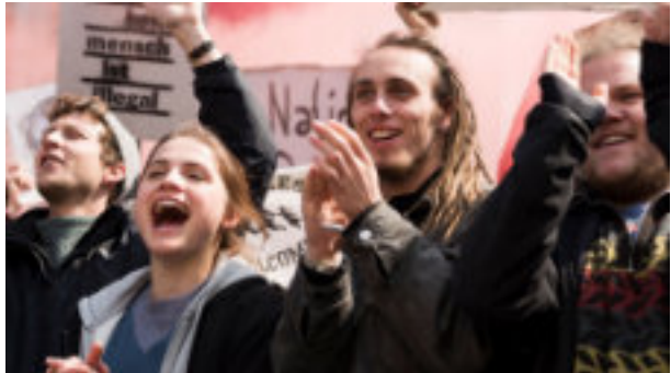
"Und morgen die ganze Welt", Spielfilm, Deutschland, Frankreich 2020, Regie: Julia von Heinz

Von besonderer Bedeutung ist es dabei, nicht nur die unterschiedlichen Perspektiven der Filme zu beleuchten, sondern vor allem auch mit Betroffenen ins Ge-