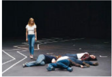
"Reconstructing Utøya", Schweden, Norwegen, Dänemark, 2018